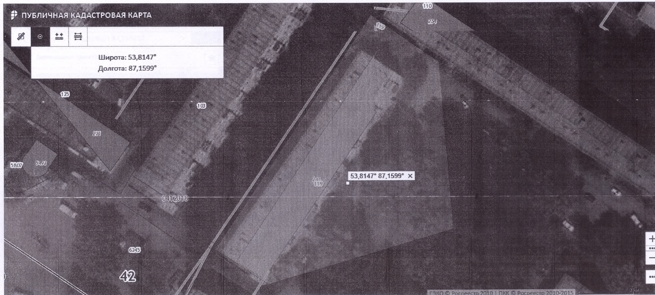
Схема земельного участка, по адресу: Кемеровская обл., г. Новокузнецк, Заводской район, ул. 40 лет ВЛКСМ, д. 124